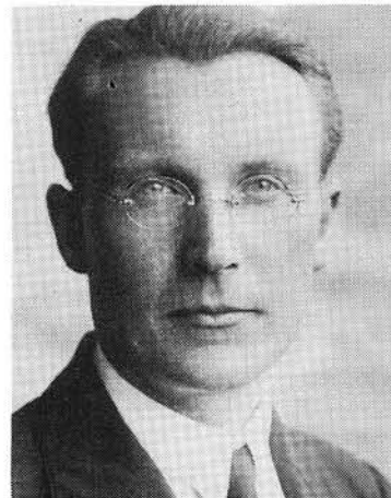
Le jeune professeur.

ouvrages de l'anglais en français, parfois en dictant la traduction. Il a aussi souvent traduit en public. En 1979, au cours d'une prédication à Sydney pour un groupe italo-français, il a parlé en italien et s'est traduit lui-même phrase après phrase. Fernand Augsburger apporte ce témoignage : « Impossible d'oublier l'art clair et concis dont il faisait preuve s'il était appelé à traduire un orateur de langue anglaise ou italienne. » ■